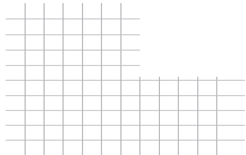
Matriz 2. Matriz de clasificación de riesgo.