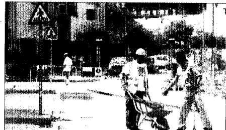
EN EL TAJU. Obras del Plan 8.000 en la calle Barrera.

El PSOE lleva ya una docena de actos tanto vecinales como sectoriales para explicar el impacto del Plan 8.000 sobre la economía local. Ayer, el regidor convocó de urgencia a todos los medios para destacar