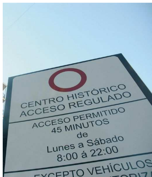
El tráfico también preocupa

preocupaciones para los sevillanos son la seguridad ciudadana (3,7%) y la falta de aparcamiento (3,5%). Este es el primer barómetro de la Fundación Antares que se realiza tras la toma de posesión de Juan Ignacio Zoido como alcalde. Sobre la gestión del Ayuntamiento, los sevillanos aumentan alrededor de medio punto su valoración, siendo el transporte público lo más valorado (6,3 puntos sobre 10), seguido de los centros de enseñanza (5,9). Las peores notas se las llevan las viviendas de protección oficial, con un 4,9, y la limpieza de la ciudad, 4,8.