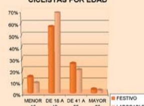
CICLISTAS POR EDAD