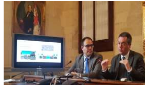
El Alcalde de Sevilla Juan Espadas en la presentación del proyecto

Una vez redactado este Plan Especial, se aprobará en Junta de Gobierno este mes de marzo y se abrirá un plazo para alegaciones, con el objetivo de que pueda estar ratificado después del verano para que se pueda licitar a finales de año o principios de 2019 el proyecto constructivo del primer tramo, el que uniría San Bernardo con Nervión.