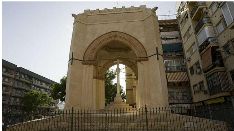
El Humilladero de la Cruz del Campo es uno de los espacios protegidos

Entre los edificios protegidos se encuentran el Humilladero de la Cruz del Campo, la Parroquia de la Inmaculada Concepción, el Parque de la Ranilla, la Casa Duclós, el antiguo Matadero Municipal y Mercado de Reses o el patronato de Casas Baratas en la Avenida Ramón y Cajal.