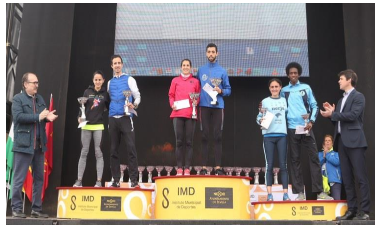
Los ganadores de la carrera recibiendo sus trofeos

En la carrera también participaron 4.000 escolares, con edades desde prebenjamín hasta cadete, y menores de edad con diversidad funcional asistida, la mayoría pertenecientes a la Asociación Carros de Fuego.