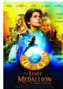
EL MEDALLÓN PERDIDO

Lugar: Plaza Alcalde Horacio Hermoso (Tiro de Línea)