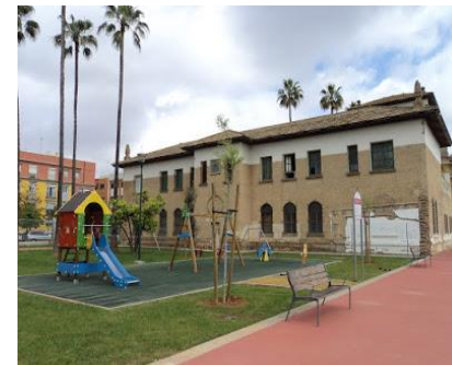
El Parque de la Ranilla en el Distrito Nervión

El presupuesto de licitación de ambas obras ha sido de 107.576,28 euros.