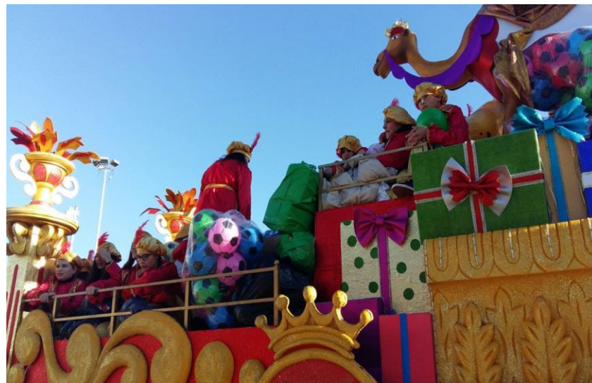
Imagen de la Cabalgata de Reyes del Distrito

Entre las organizaciones participantes se encuentran la Asociación Amanecer, el Centro Deportivo El Pilar, las Asociaciones Raices, León Felipe, Huerta de Santa Teresa, la Unidad, Nuestro Padre Jesús de la Salud, la Intercomunidad El Zodiaco, la Hermandad El Cautivo y el AMPA Dulce Chacón.