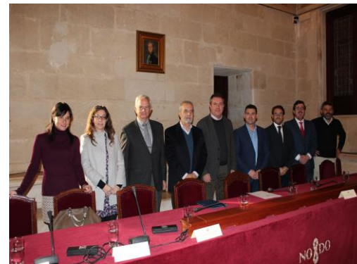
El alcalde de Sevilla Juan Espadas junto al Delegado de Bienestar y Empleo, Juan Manuel Flores

Los proyectos están dirigidos a personas desempleadas empadronadas en la ciudad de Sevilla, en búsqueda activa de empleo que por diversas circunstancias presentan mayor vulnerabilidad, pertenecientes a colectivos como jóvenes, mayores de 45 años, desempleados de larga duración, discapacitados, personas sometidas a maltrato, inmigrantes o personas en proceso de rehabilitación o reinserción social.