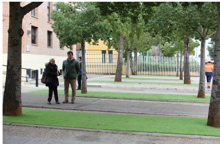
La Delegada del Distrito Inmaculada Acevedo

Estas intervenciones, cuyo presupuesto de licitación ha sido de 60.415,18 euros, responden a diferentes peticiones de entidades vecinales y de particulares que llevaban años reclamándolas.