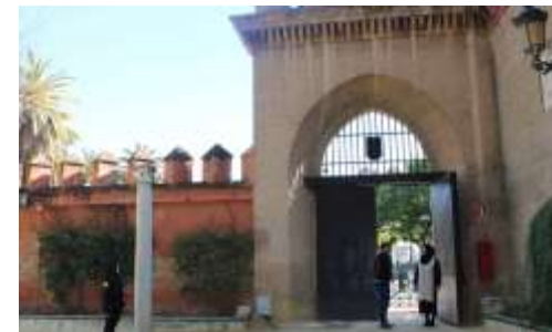
Puerta de la Alcoba del Real Alcázar de Sevilla, lugar donde comienzan las visitas guiadas.

A esta nueva forma de ver este conjunto monumental se agregan las entradas gratuitas de los lunes –de 16.00 a 17.00 horas de octubre a marzo–, que se reservan también por internet.