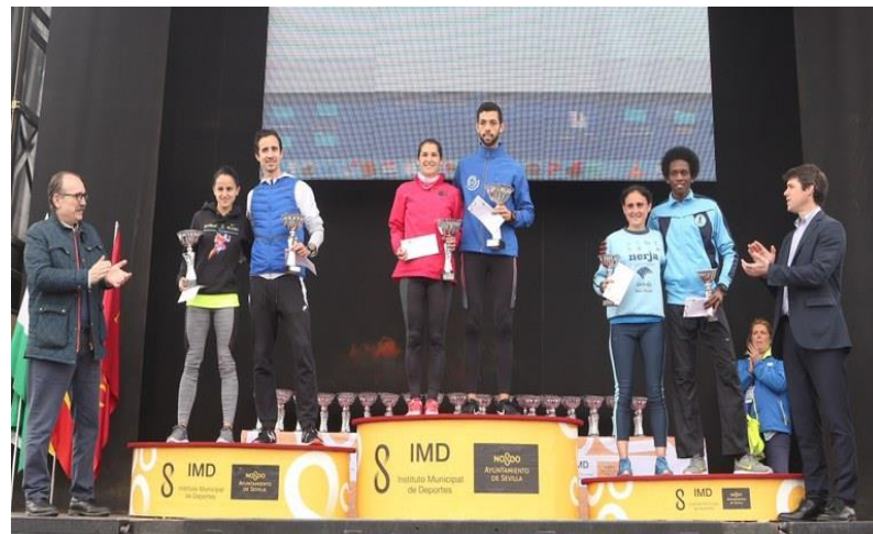
Los ganadores de la carrera recibiendo sus trofeos

En la carrera también participaron 4.000 escolares, con edades desde prebenjamín hasta cadete, y menores de edad con diversidad funcional asistida, gran parte de ellos pertenecientes a la Asociación Carros de Fuego.