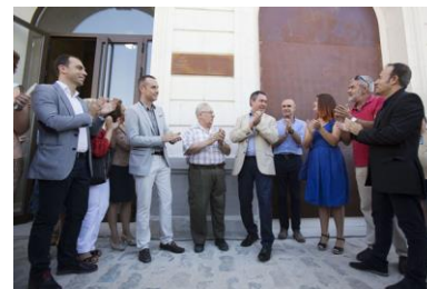
El alcalde, Juan Espadas, junto a representantes municipales y de los placeros, el día de la inauguración

Una vez terminadas las obras del mercado, se ha iniciado ya la construcción del nuevo centro deportivo, que contará con instalaciones de primer nivel e incorporarán los últimos avances tecnológicos en este campo. El coste estimado del centro