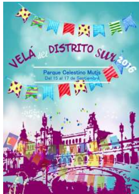
Cartel de la Velá del Distrito Sur del año pasado

El premio consistirá en una placa conmemorativa y la publicación de la obra ganadora como el cartel oficial de la Velá del Distrito Sur. El Jurado estará compuesto por el Delegado del Distrito y dos miembros de la Junta Municipal del Distrito Sur.