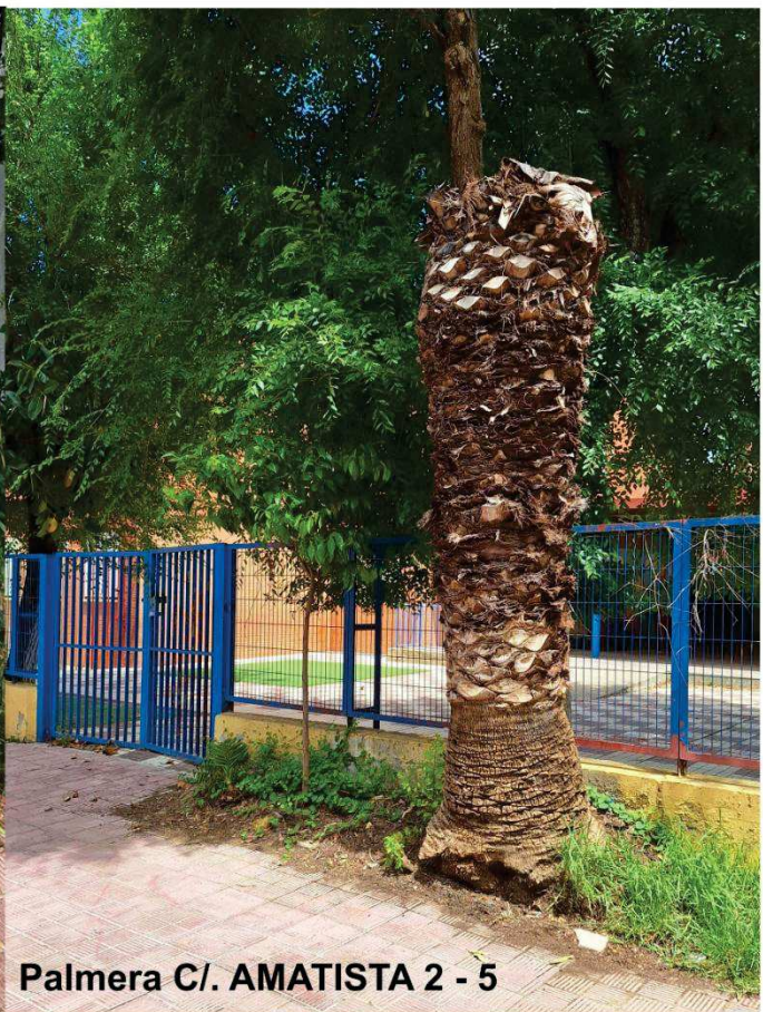
Palmera C/. AMATISTA 2 - 5