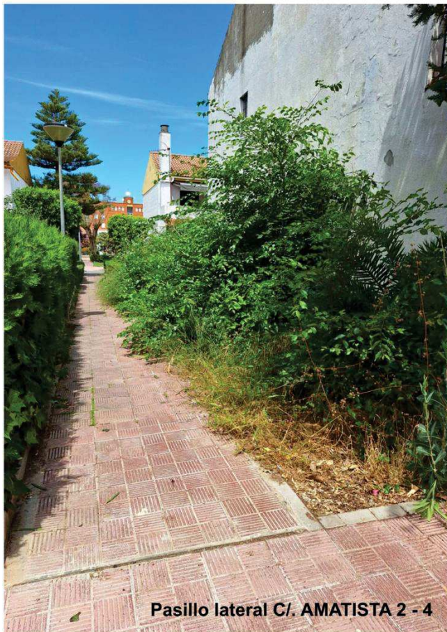
Pasillo lateral C/. AMATISTA 2 - 4