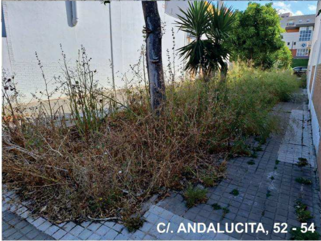
C/. ANDALUCITA, 52 - 54