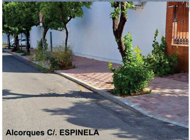
Alcorques C/. ESPINELA