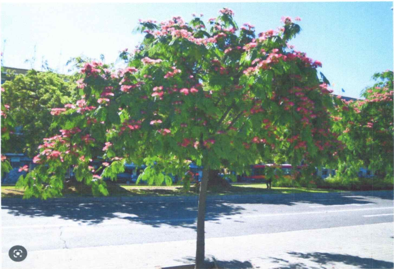
Acacia de Constantinopla (Albizia julibrissin) | wikitreesevilla