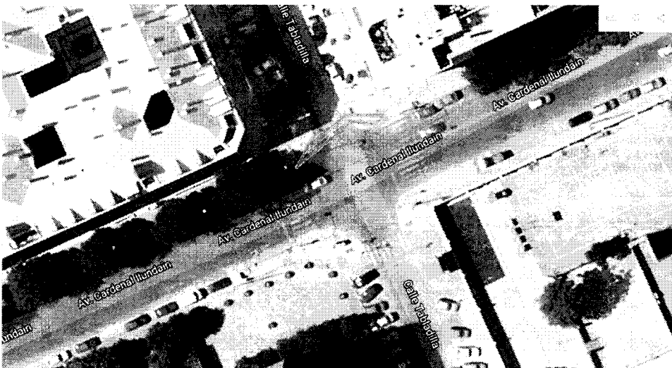
Ilustración 3: traza propuesta