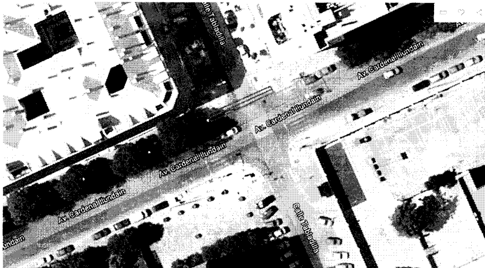
Ilustración 2: traza actual