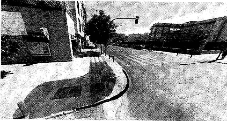
Ilustración 5: situación del nuevo trazado del carril bici en amarillo y vallado en rojo.

También se propone un vallado de seguridad con el fin de “encauzar” o dirigir el tránsito de bicicletas hacia la nueva zona con el fin de evitar posibles atropellos.