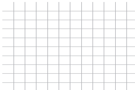
Matriz 2. Matriz de clasificación de riesgo.