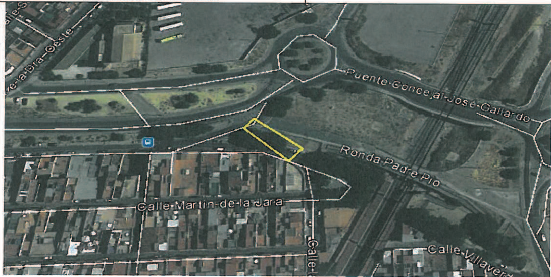
PLANO DE SITUACION C/ RONDA PADRE PIO Nº80