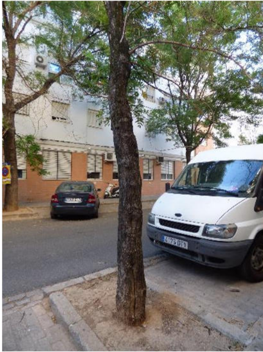
Vista de tronco y base