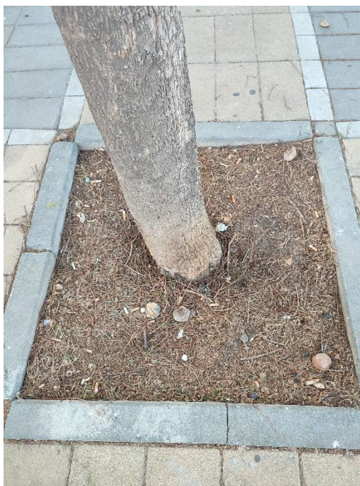
Imágenes del ejemplar con id 40480