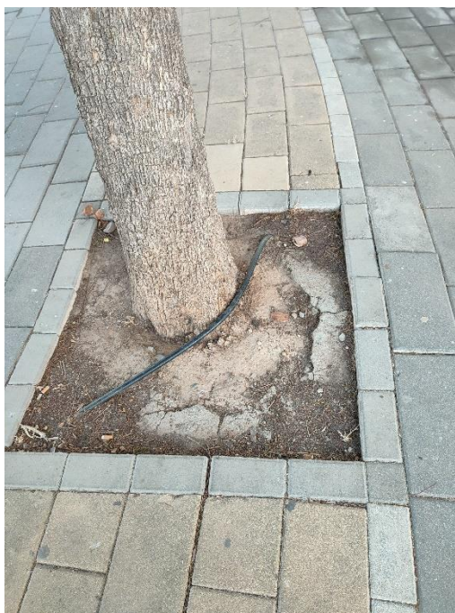
Imágenes del ejemplar con id 40496