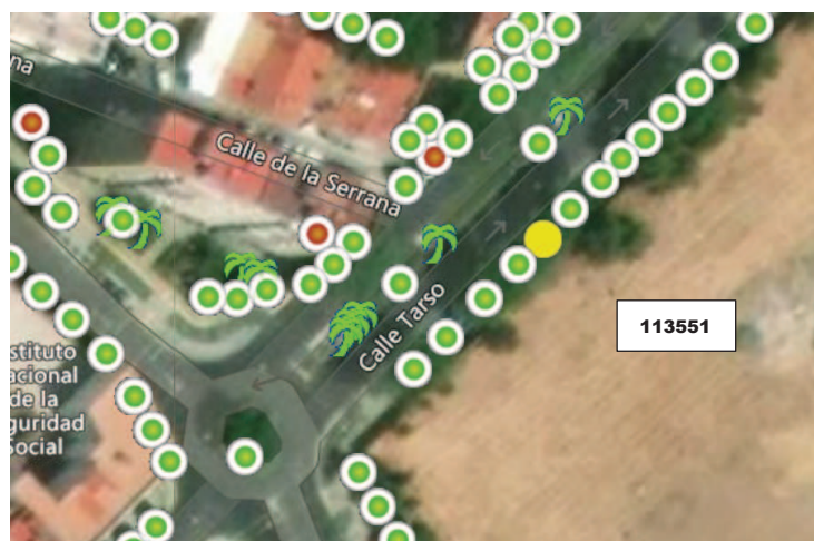
Localización del ejemplar en color amarillo