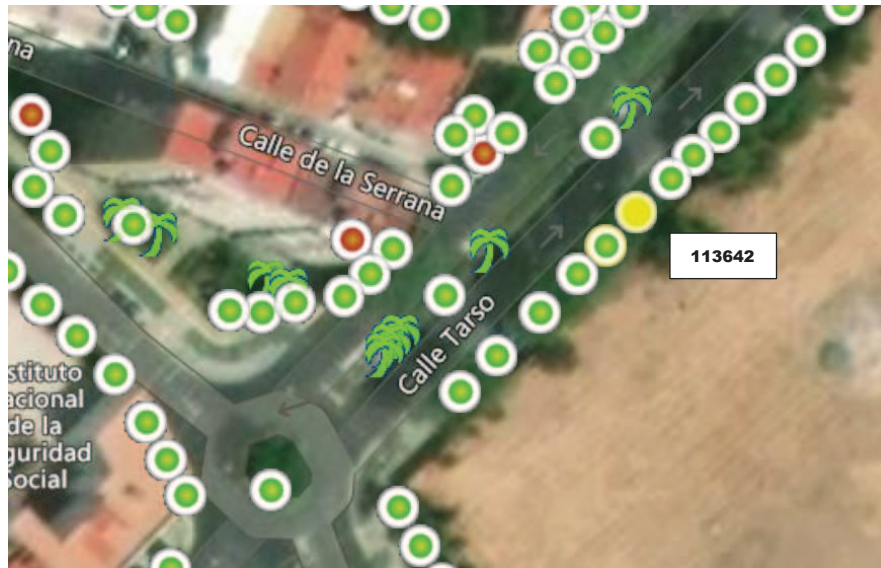
Localización del ejemplar en color amarillo