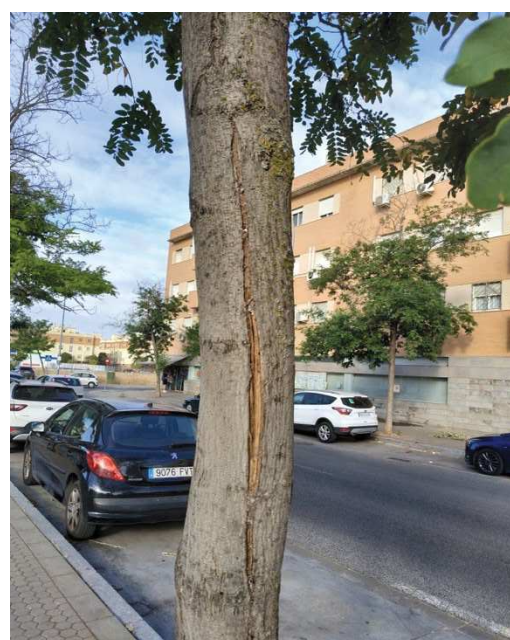
Grietas y fisuras en tronco