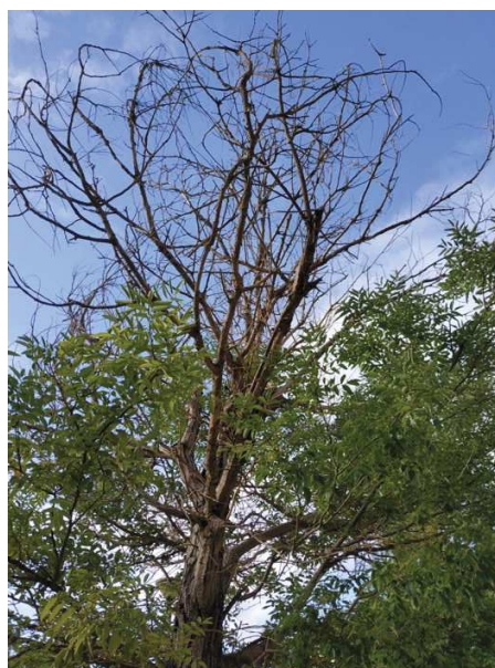
Vista general del ejemplar con id 44034, copa seca