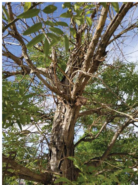
Heridas y grietas en tronco y ramas