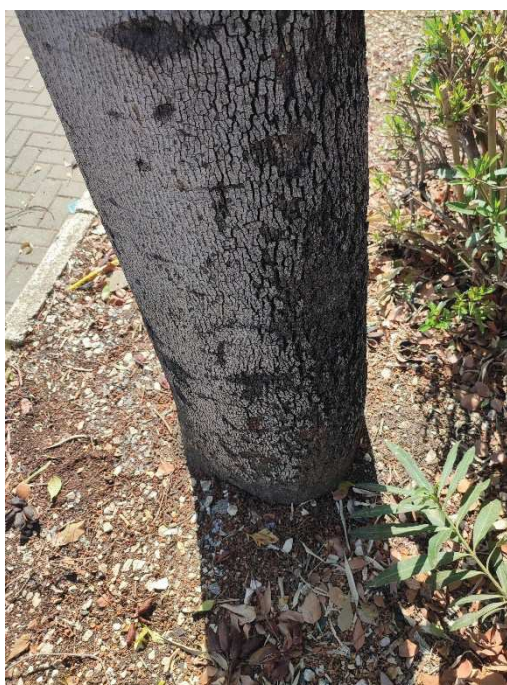
Imágenes del ejemplar con id 137