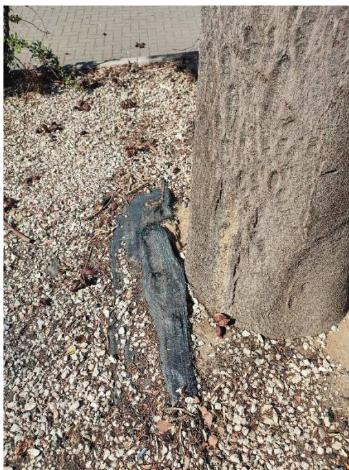
Imágenes del ejemplar con id 151