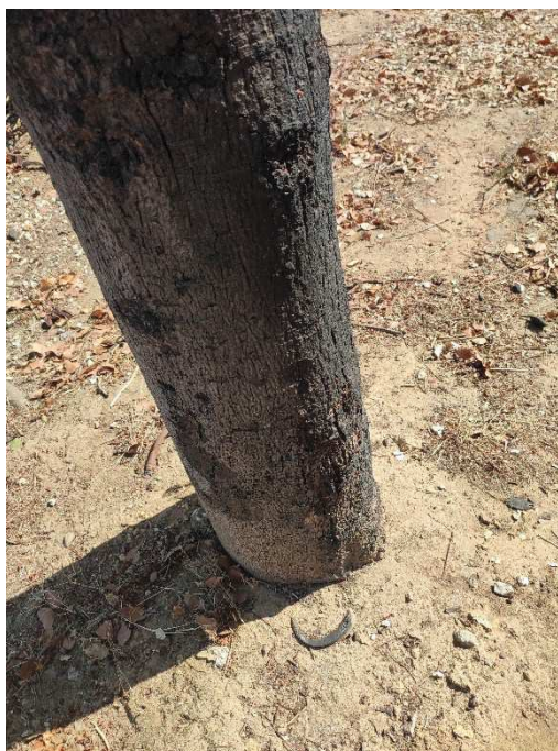
Imágenes del ejemplar con id 169