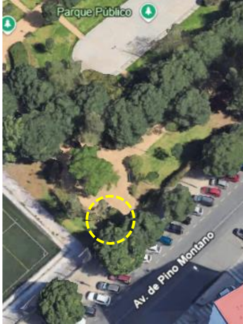
Localización: Grevillea robusta con ID 40883 en el Parque José María de los Santos del Distrito Norte.