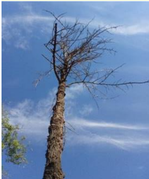
Defoliación y ramas secas superior al 90% de la copa, y descortezamiento con fendas verticales