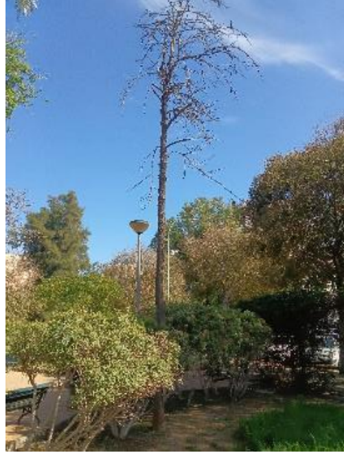
Vista general: árbol seco.