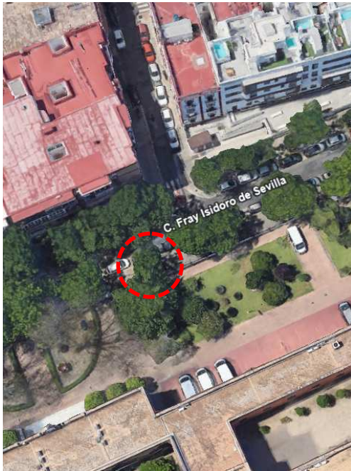
Localización: Melia azedarach con ID 116 en la Calle Fray Isidoro de Sevilla del distrito Macarena