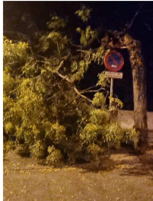
Vista general: copa desgajada en día de vientos moderados.