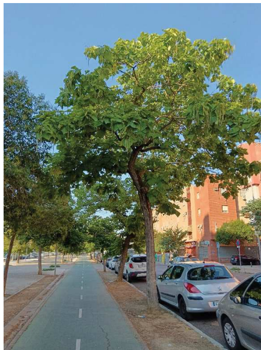
Vista general del ejemplar con id 43929