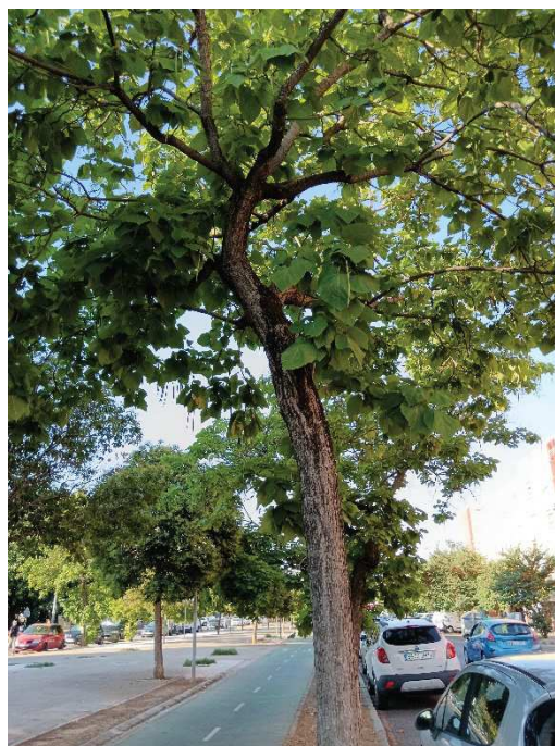
Detalle de cuello y copa