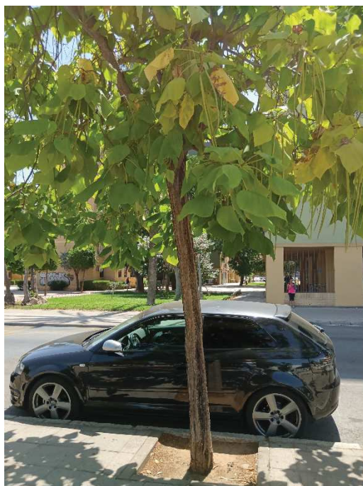
Vista general del ejemplar con id 3