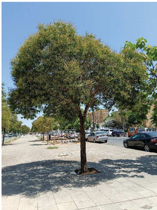
Vista general del ejemplar con id 43847