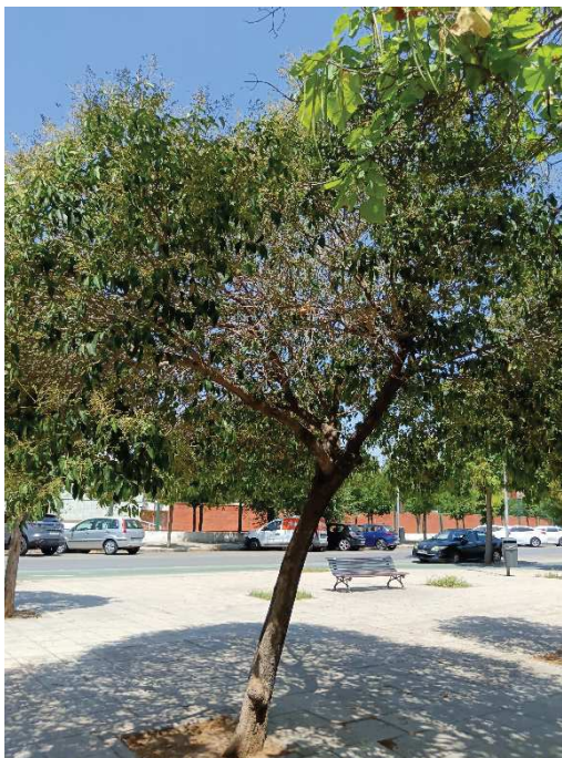
Vista general del ejemplar con id 43851