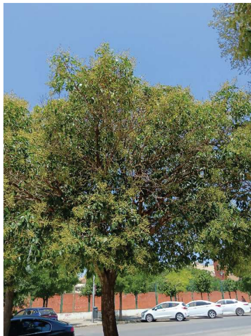
Vista general del ejemplar con id 43859