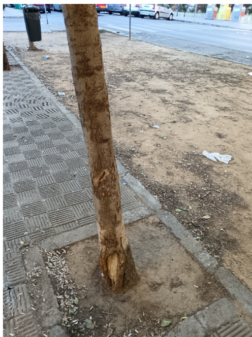
Detalle de lesiones en tronco