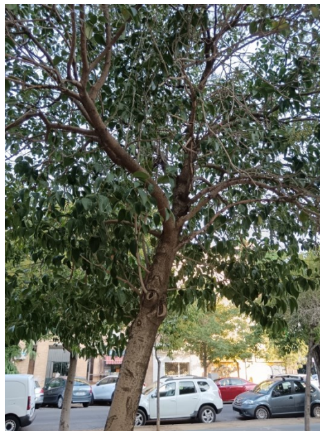
Vista general del ejemplar con id 43731. Madera vista por cortes de poda.