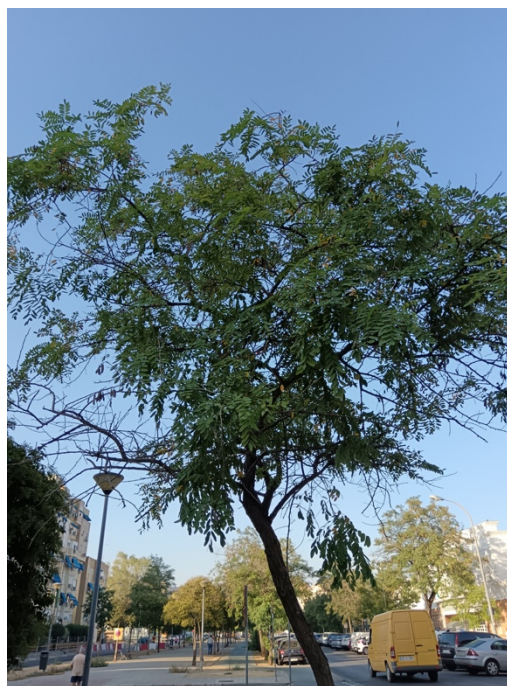
Vista general del ejemplar con id 43768, ramas puntisecas