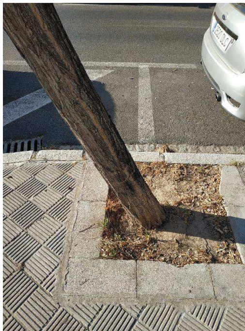
Vista general del ejemplar con id 43576