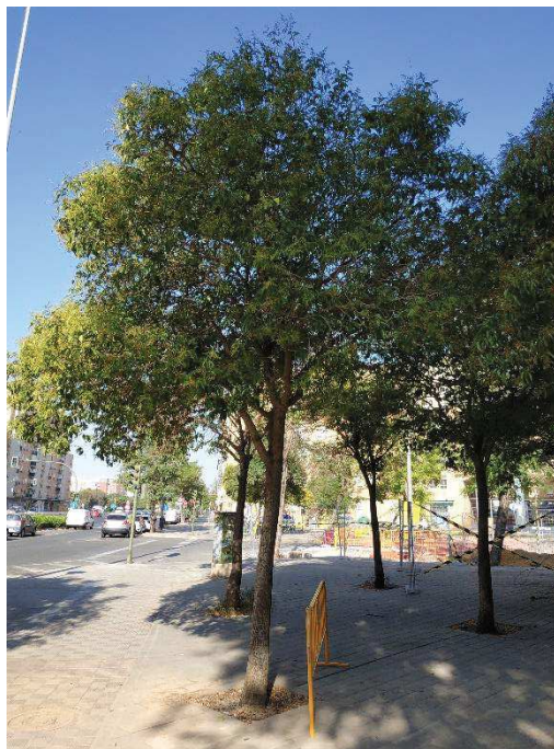
Vista general del ejemplar con id 123408