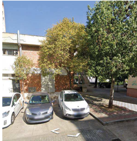
StreetView febrero de 2022