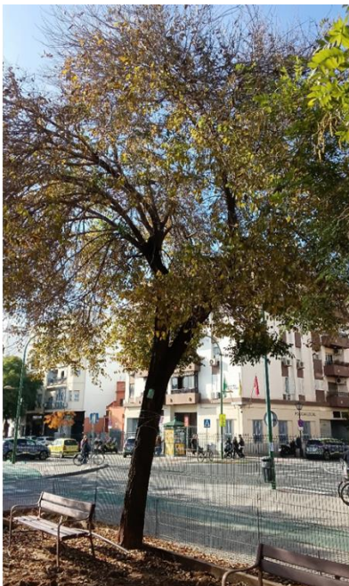
Vista general: árbol desvitalizado y ligeramente inclinado