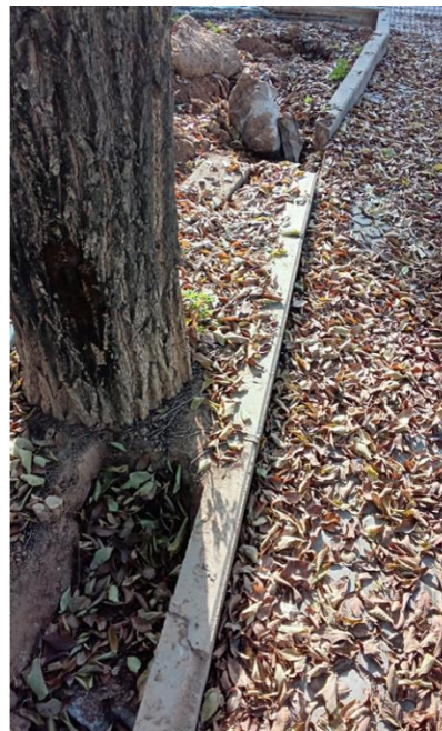
Interferencia con línea de bordillo y nuevo vallado