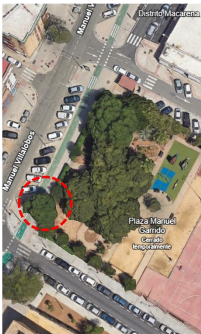
Localización: Ulmus pumila con ID 6 de la Plaza Manuel Garrido, Distrito Macarena