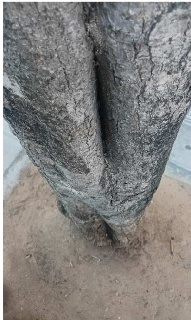
Heridas en tronco con madera vista/pudrición