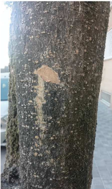
Prueba árbol seco