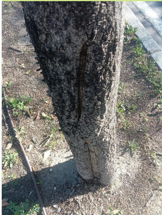
Herida longitudinal desde el cuello a la parte inferior del tronco con madera vista/pudrición.