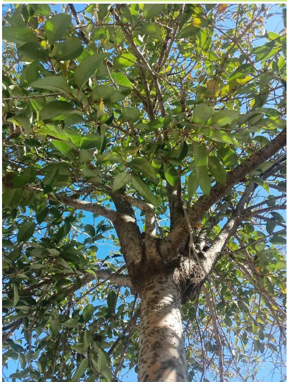
Copa elíptica y con estructura recogida, con interferencias con vehículos