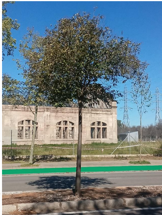
Vista general: árbol desvitalizado