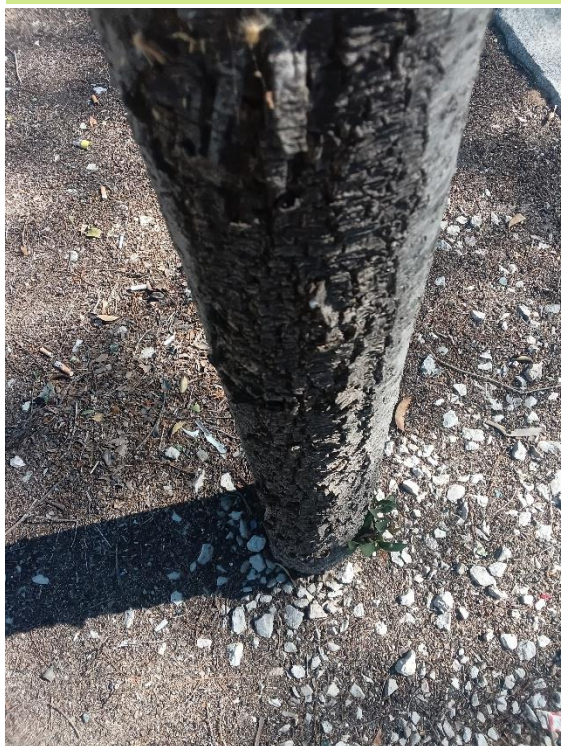
Herida longitudinal desde el cuello a la mediación del tronco con cámbium disfuncional