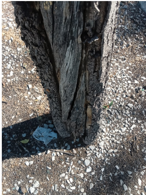
Importante herida longitudinal desde el cuello a la parte superior del tronco con madera vista/pudrición/cavidad y pérdida de sección