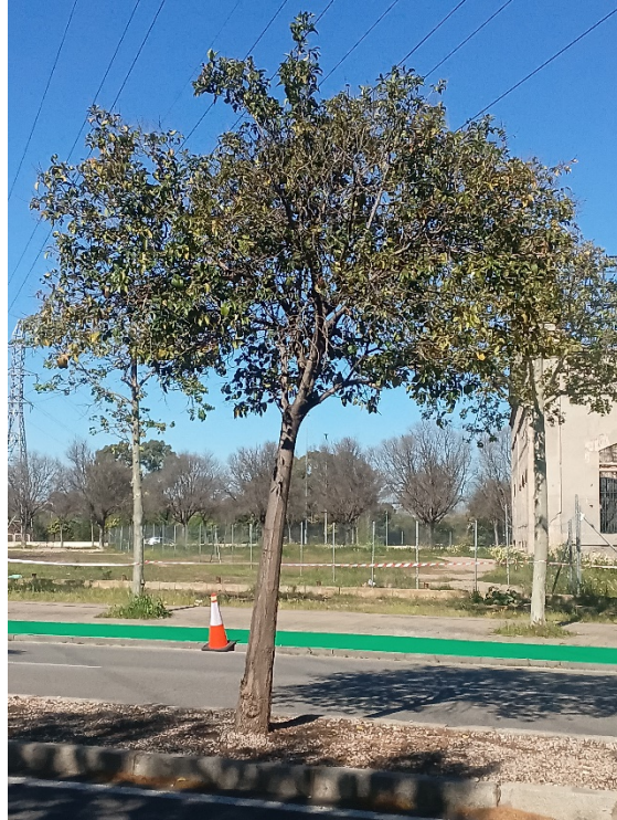
Vista general: árbol desvitalizado, interferencias con edificio