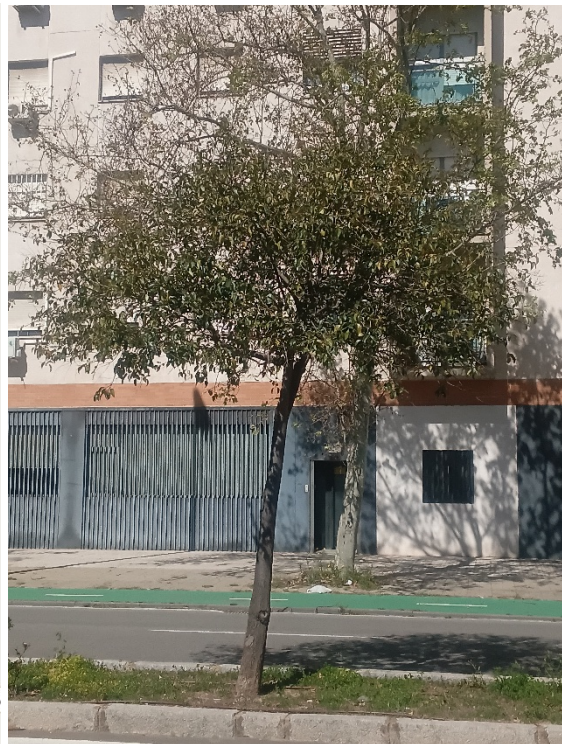
Vista general: árbol desvitalizado, interferencias con vehículos