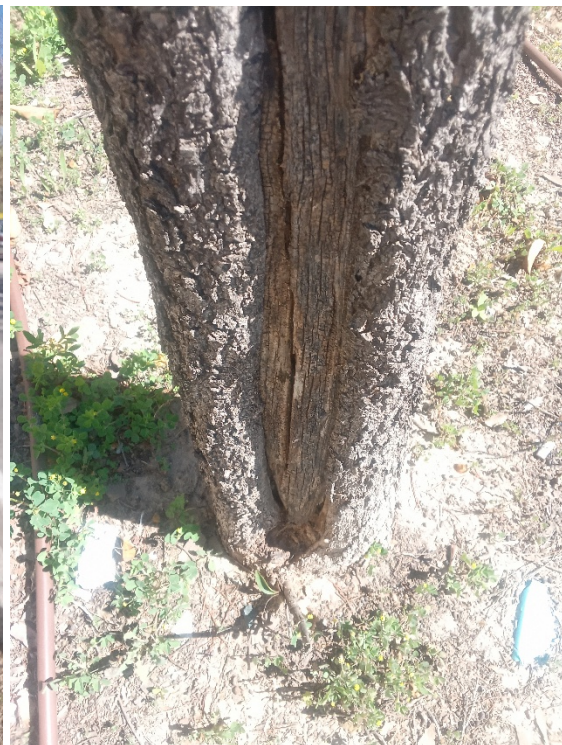
Importante herida longitudinal desde el cuello hasta la cruz/base de primarias con madera vista/pudrición y pérdida de sección.