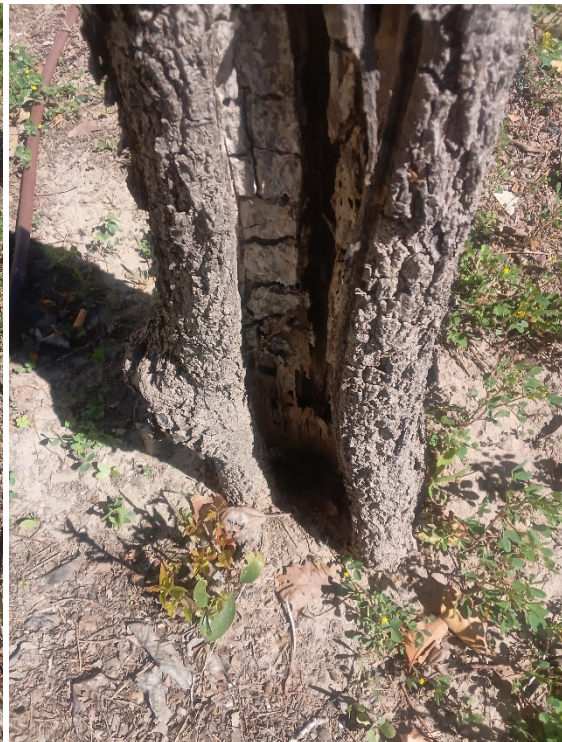
Importante herida longitudinal desde el cuello hasta la mediación del tronco con pudrición/cavidad y pérdida de sección.