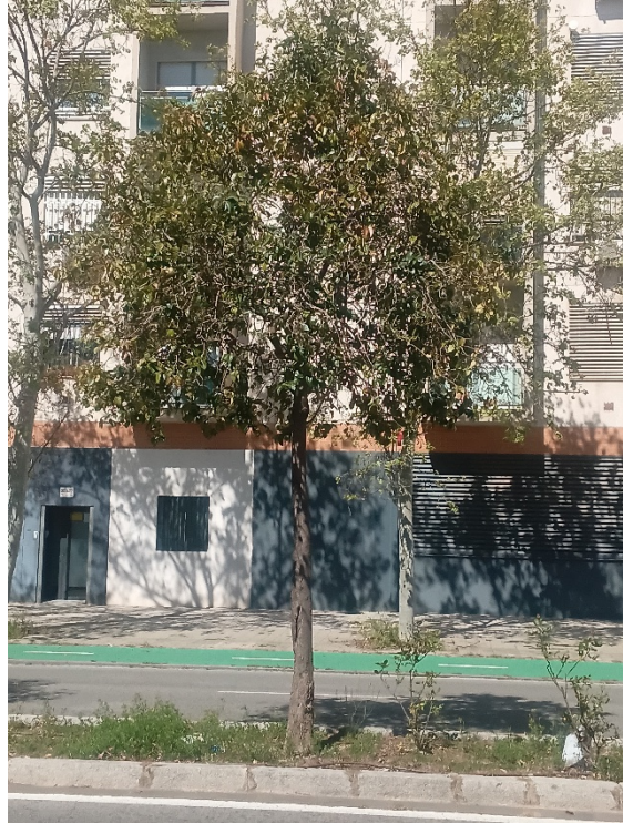
Vista general: árbol desvitalizado, interferencias con vehículos