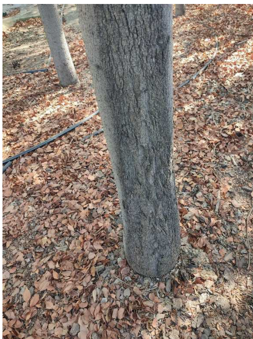
Imágenes del ejemplar con id 103974