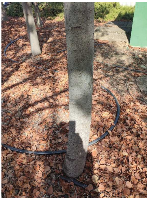
Imágenes del ejemplar con id 44239